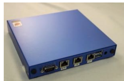
Contegos safe connect Appliance

In Kooperation mit KOBİK (Koordinationsstelle zur Bekämpfung der Internetkriminalität) entwickelt.